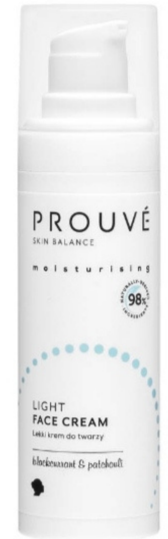
(Fig . 1)